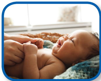
Hazme sonreír De 0 a 3 meses