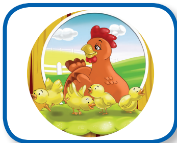
Lea una rima De 3 a 6 meses