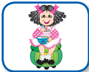
Read a Rhyme 3-6 months