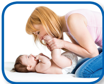
Besa mi nariz De 3 a 6 meses