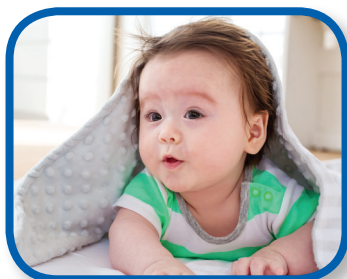
Estoy escondido De 6 a 12 meses